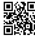
コーポレートサイト